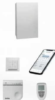
Kabellose Bedienung über Funk / App