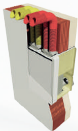
Wandintegrierter Einbau U 2 mit Kanalschluss