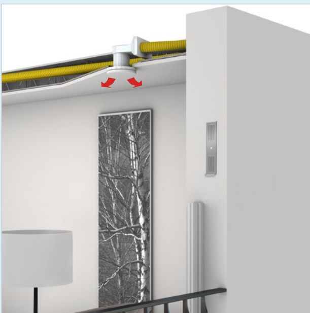
Detailbild: Option Luftzuführung über Decke und Einbauvariante Fensterlaibungslösung