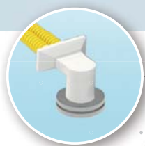
Zuluft über Decke