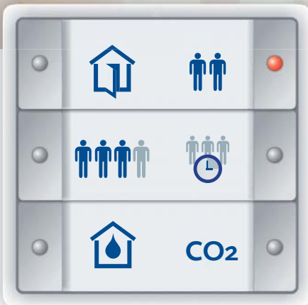
Optionen für Feuchte- und Mischgas-/CO 2 -Regelung